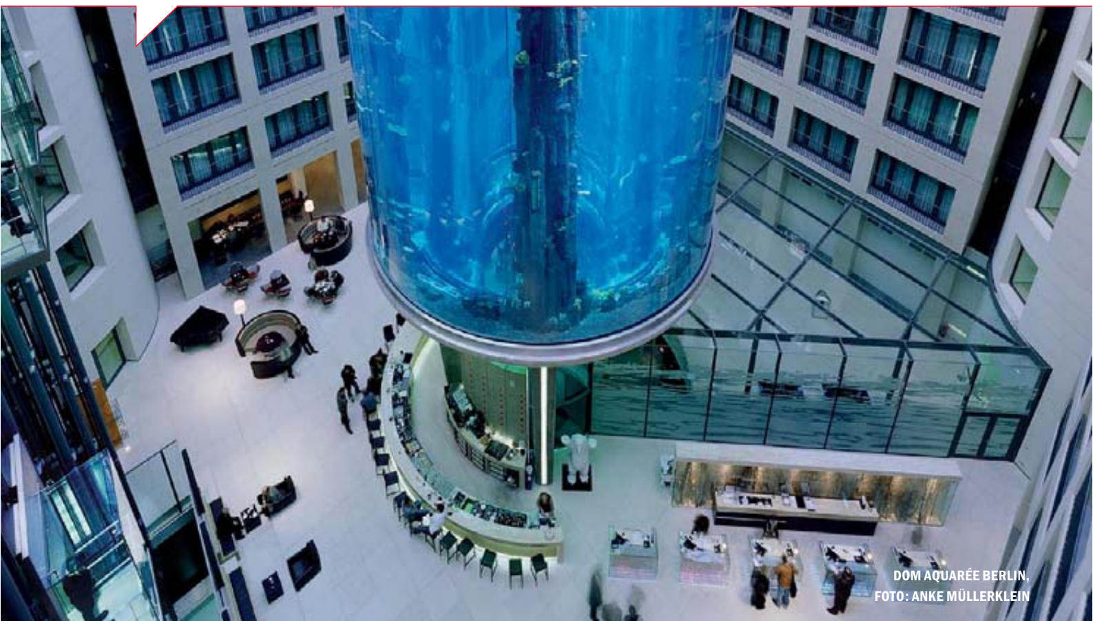
DOM AQUARÉE BERLIN