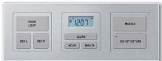
Bed Side Panel, Typ C, aluminium, Design M-PLAN