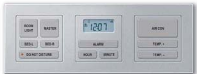
Bed Side Panel, Typ B, aluminium, Design M-PLAN